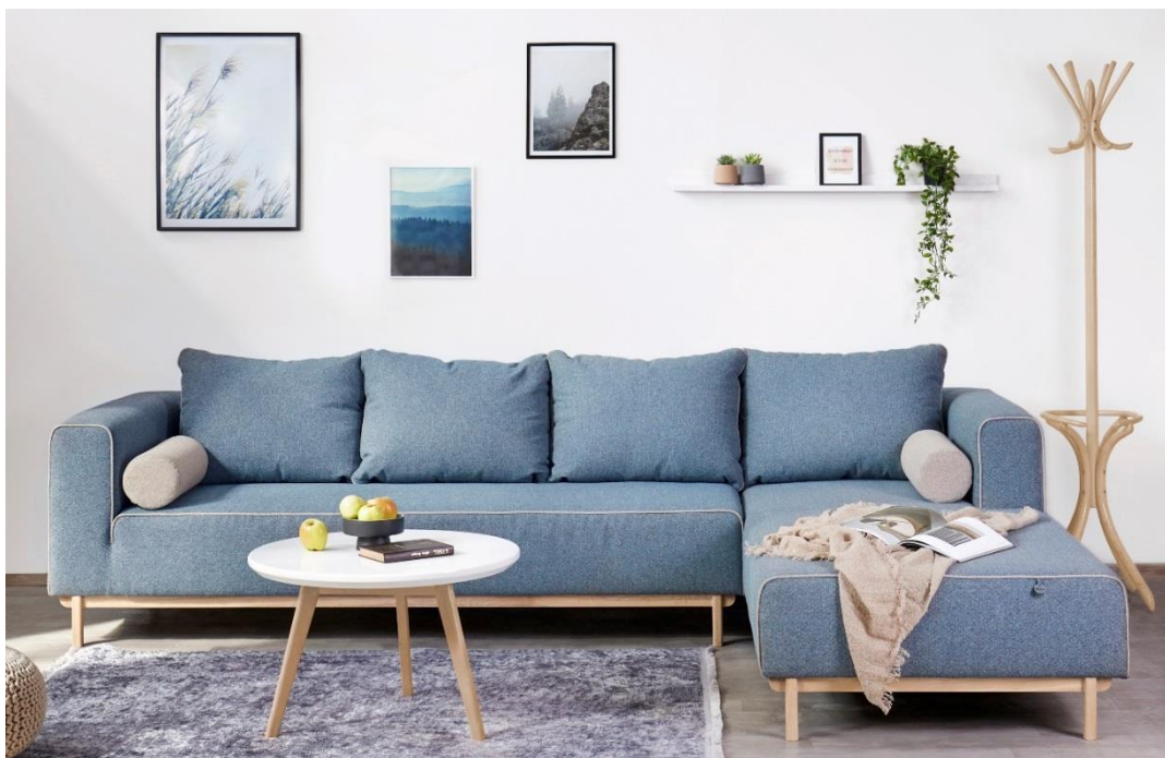
Jedan od brojnih projekata studija ELOSSO rađen u saradnji sa domaćim proizvođačima

Nakon ovih i sličnih projekata, studio će vjerovatno ići u pravcu kreiranja vlastitih proizvoda, za šta se prvenstveno treba pripremiti.