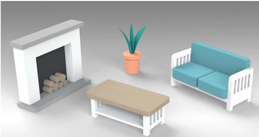
Primjer upotrebe SOLIDWORKS-a u specijaliziranim dizajnerskim djelatnostima Namještaj modeliran koristeći standardne SOLIDWORKS features-e