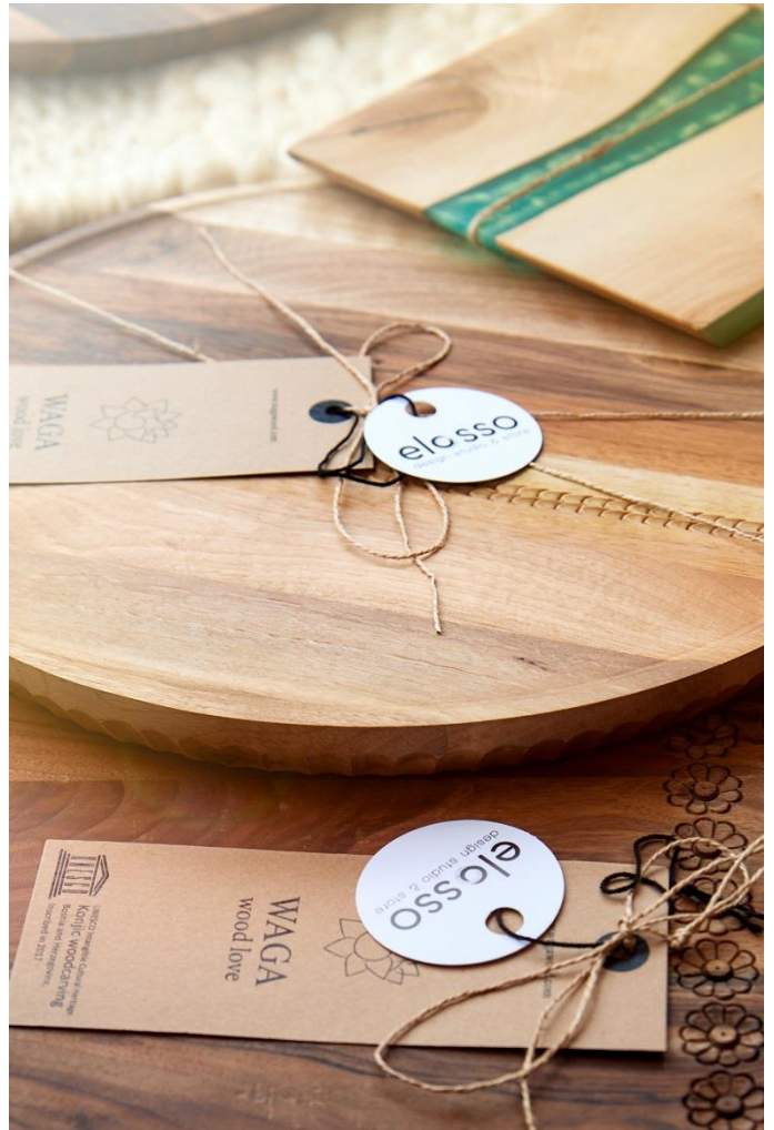
Waga Wood jedan od brendova ELOSSO studija

Suštinski, zadaća dizajnera je dati pravi odgovor na zadatak koji je pred nas stavio proizvođač. Moramo razmišljati o funkciji, estetici, ergonomiji, ekonomiji, psihologiji ali i samoj proizvodnji, pakovanju i logistici. Najveći izazov je pomiriti sve ove stvari u jednom proizvodu na način da nijedan aspekt ne trpi radi drugoga.