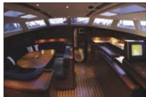
Razkošna notranjost jadrnice.